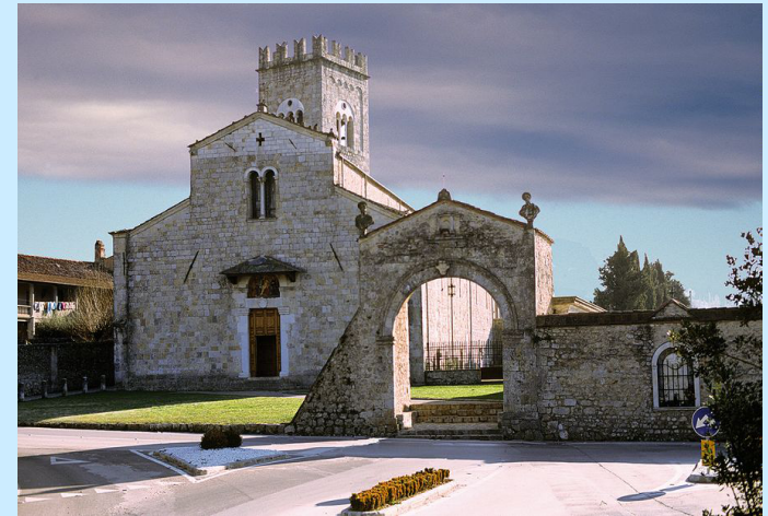
Chiesa della Badia di Camaiole

Legenda: La linea rossa che si vede nella mappa, rappresenta l'antico tracciato della Via Francigena, tratto verde rappresenta il tracciato ufficiale che ricalca l'antico.