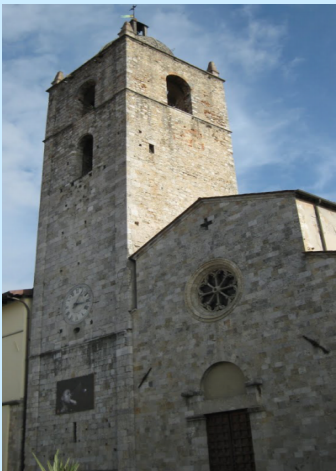
La Chiesa di S. Michele e il Museo di Arte Sacra