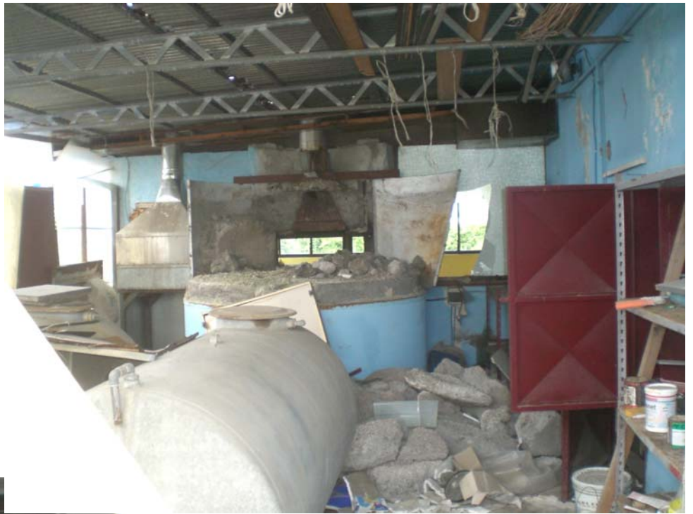
FOTO 11 cucina