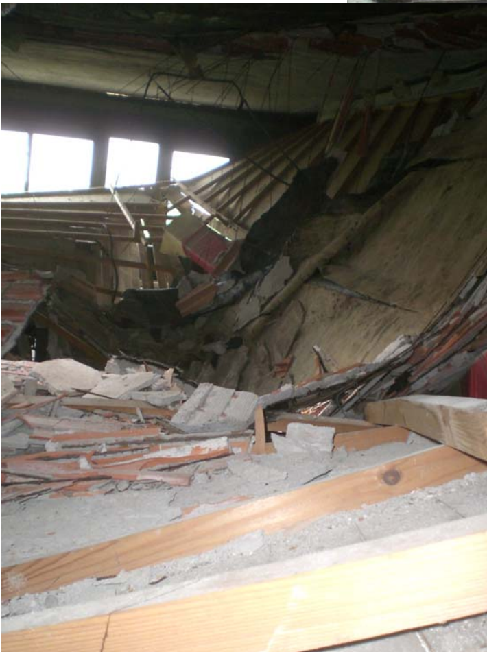
FOTO 9 soletta crollata