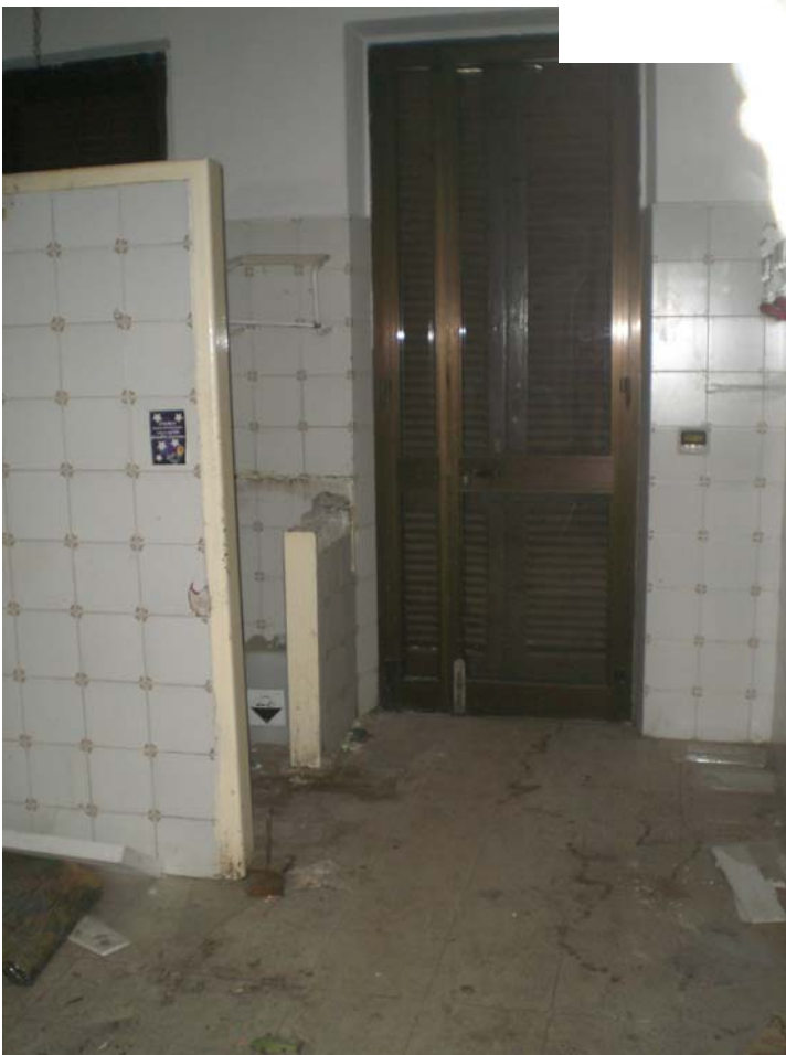
FOTO 12 scala