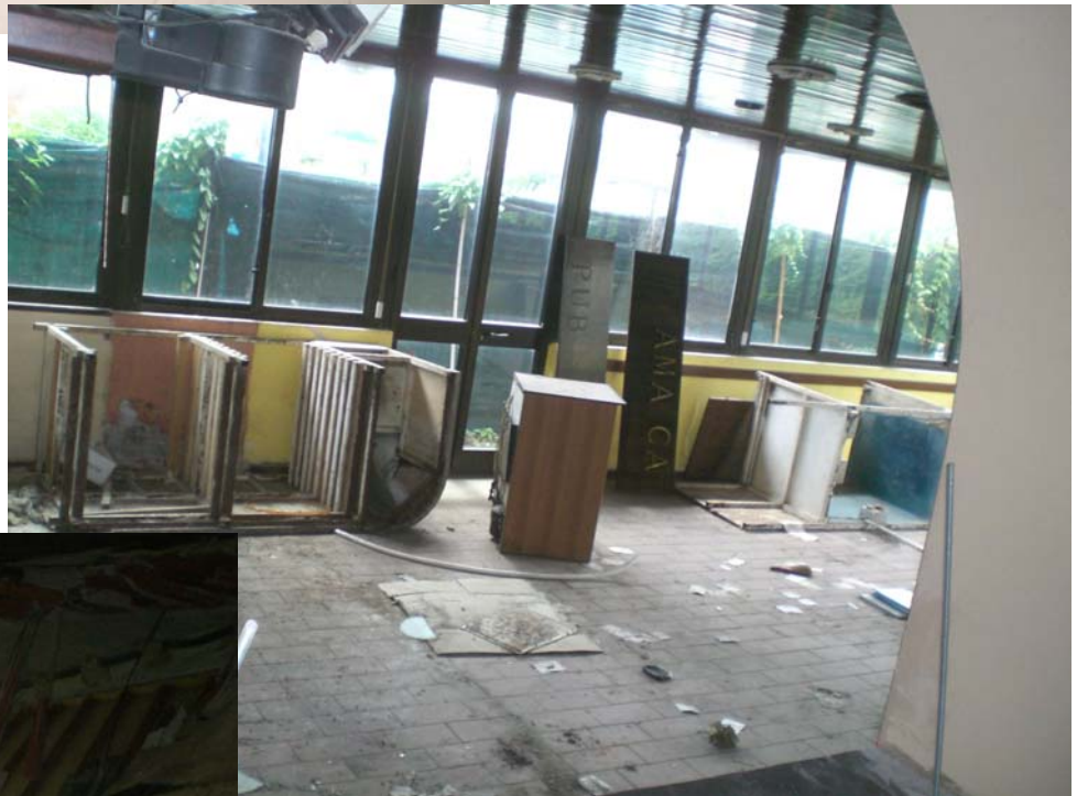
FOTO 8 sala