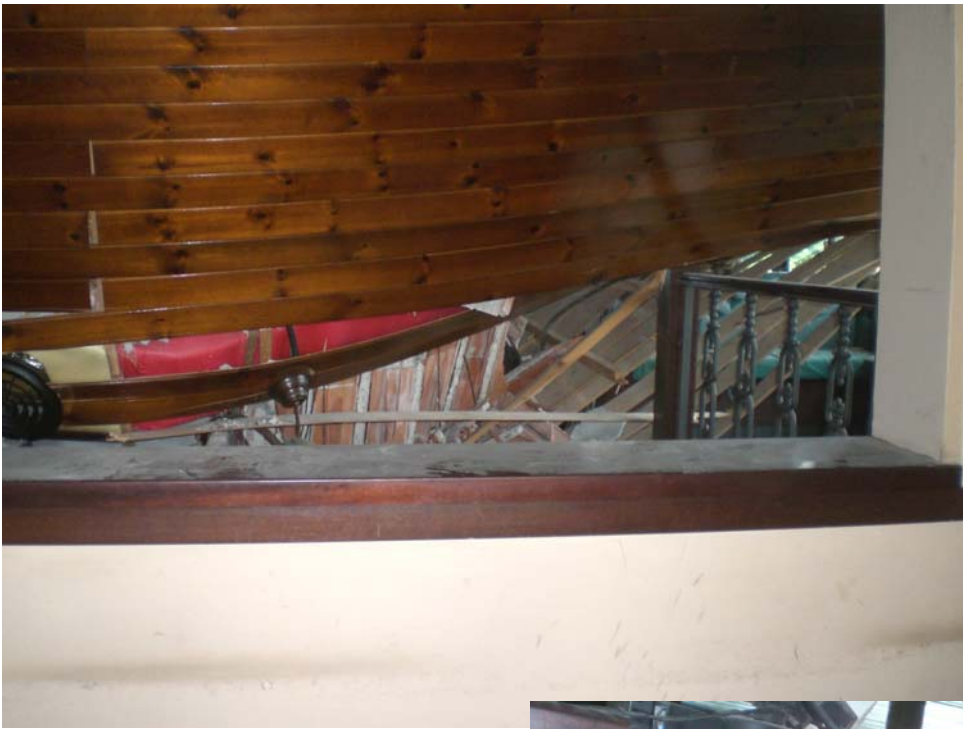
FOTO 7 soletta crollata