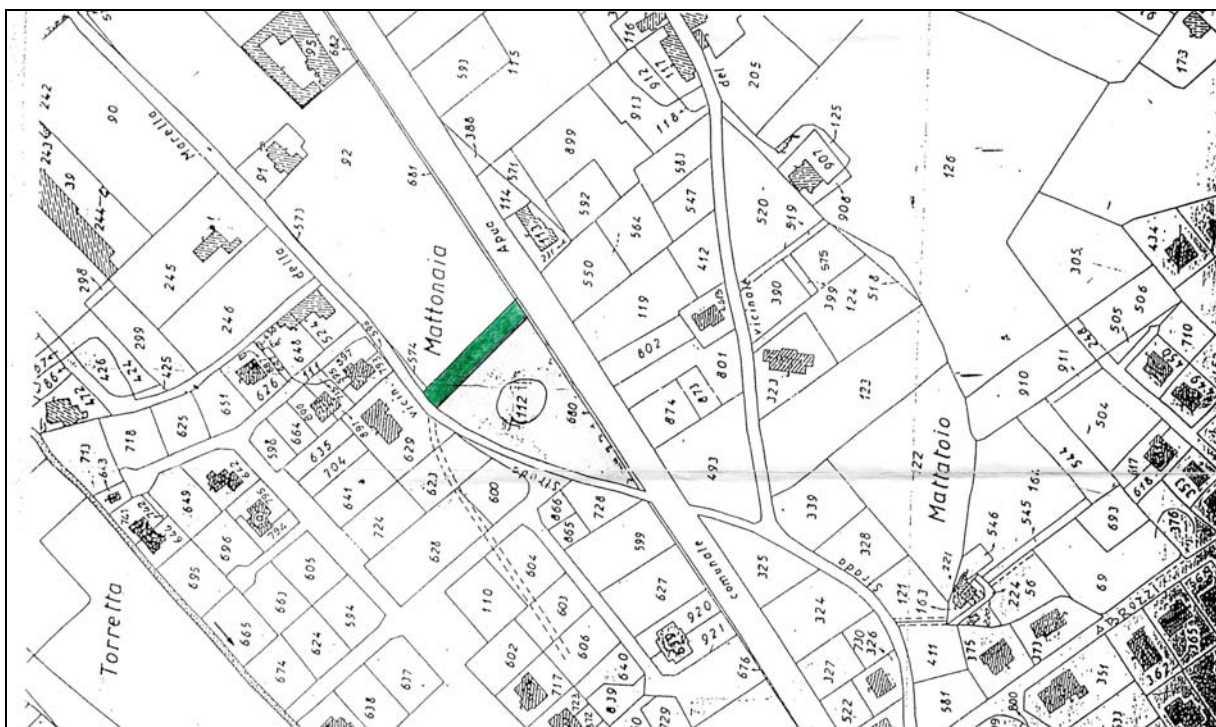
Planimetria fuori scala

Vi confinano: il viale Apua, la via Crocialetto, beni proprietà VARIA COSTRUZIONI s.r.l., salvo se altri.