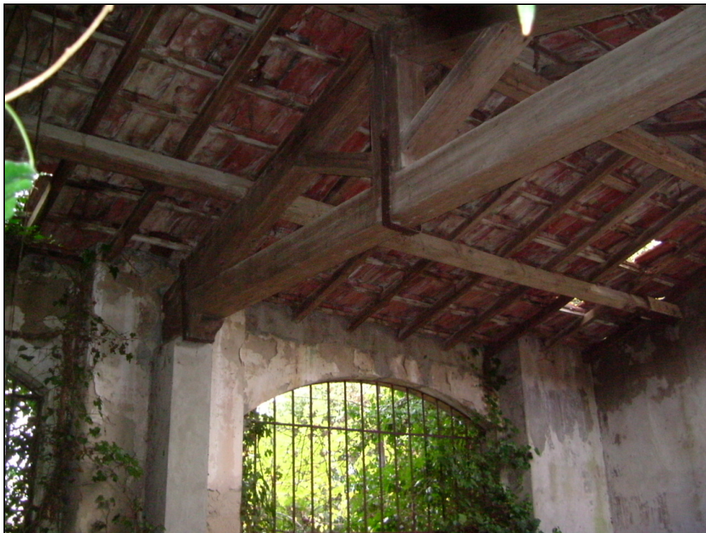
Fotografie particolari della struttura