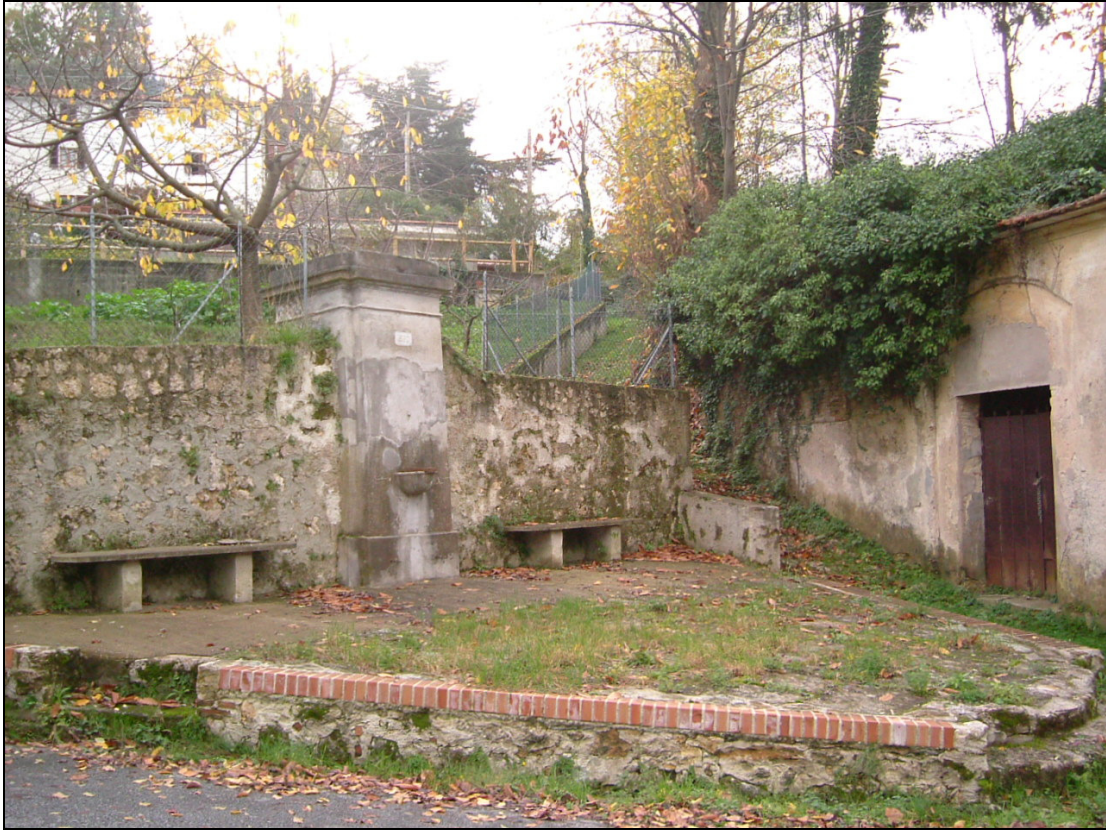
Fotografie da via Capriglia

L'immobile è inventariato alla scheda 112 dell'inventario dei beni comunali.