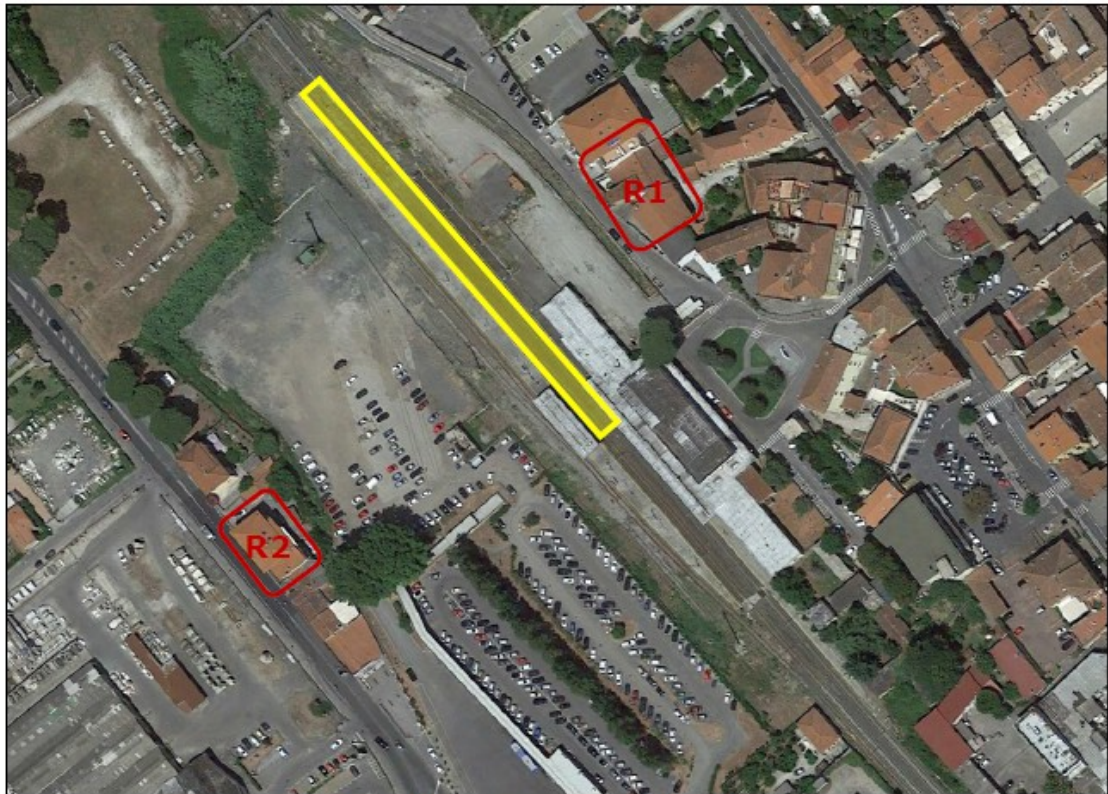
Figura 4.1. Recettori Area di cantiere Nord