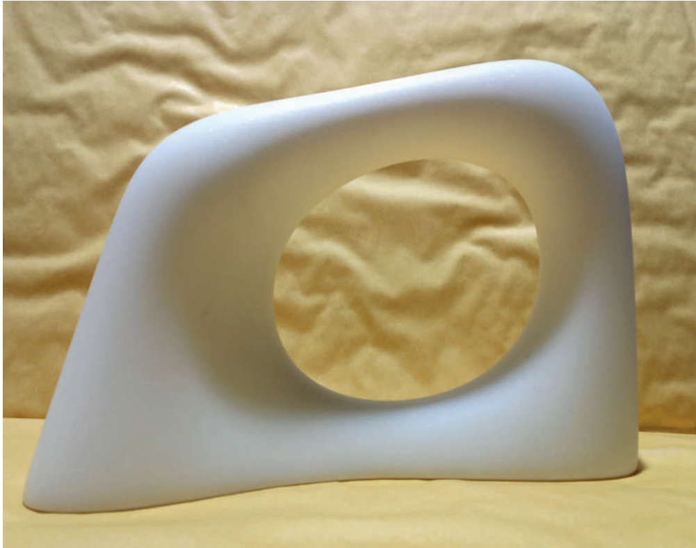
Kan Yasuda Myomu, 2017 marmo statuario cm 15,5 x 22 x 6