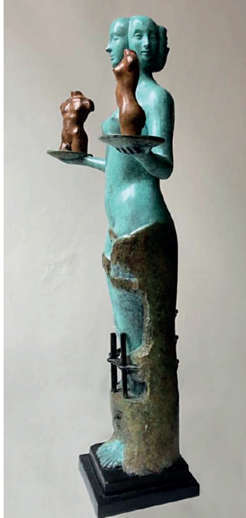
Alba Gonzales Il giusto peso, 2017 bronzo cm 55 x 35 x 12