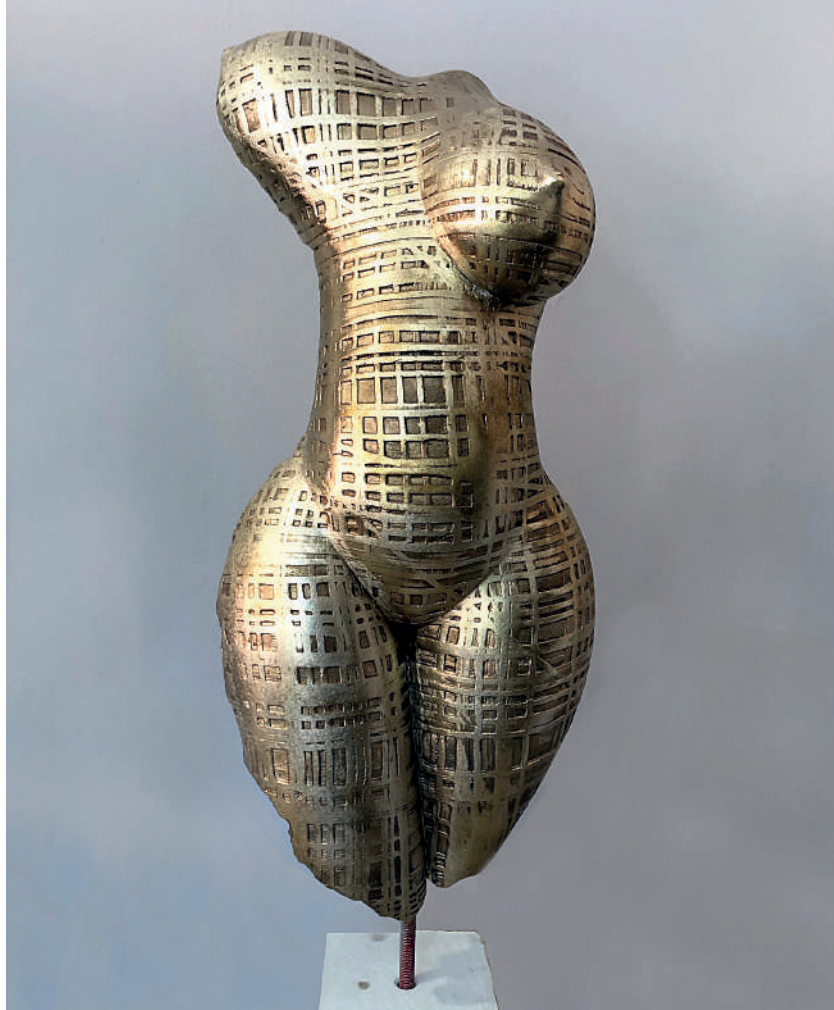
Tiziano Valentina, 2020 bronzo 1/8 cm 52 x 20 x 10