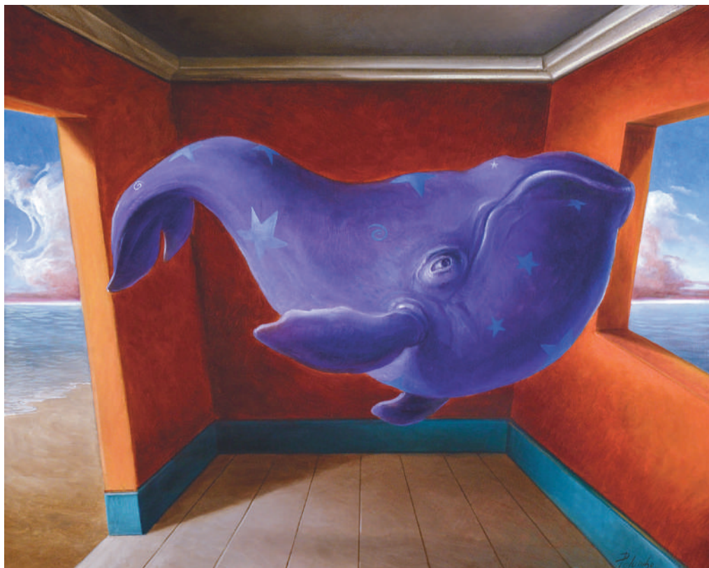
Ciro Palumbo Apparizioni, 2020 olio su tela cm 40 x 50