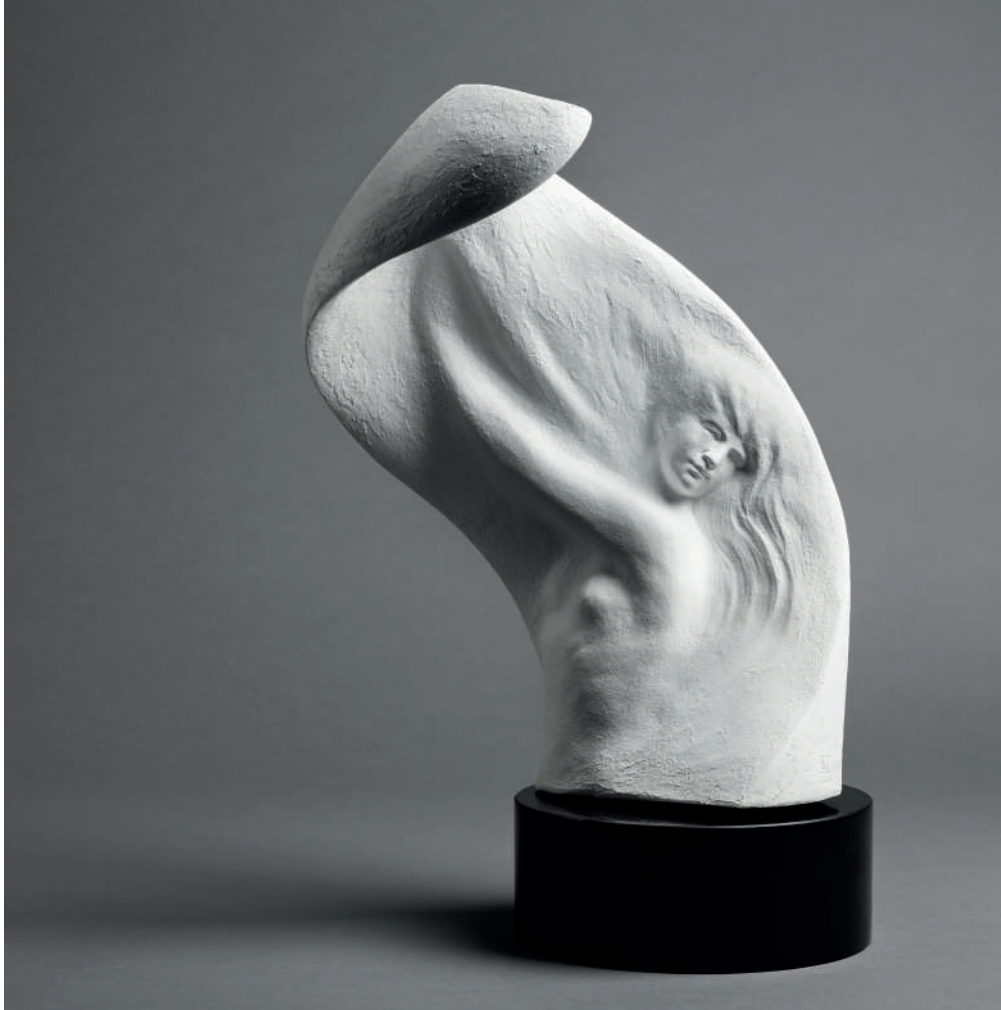
Marco Augusto Dueñas Forza, 2020 alluminio con base in marmo nero Belgio cm 42 x 23 x 20