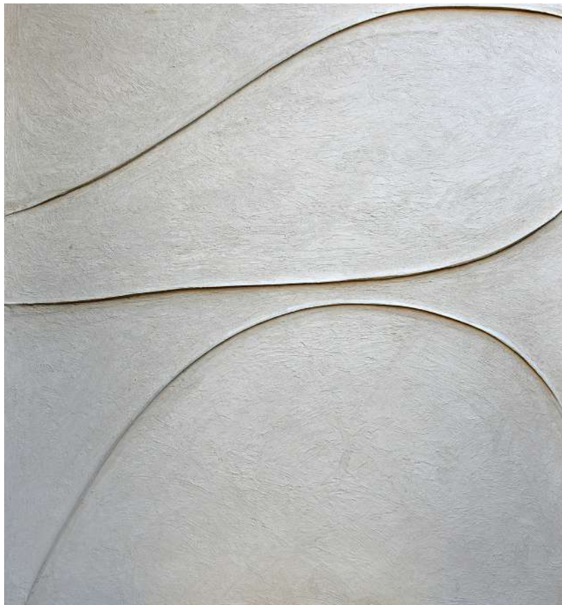
Franca Pisani Storia di due anime, 2020 ossidi, lacca cm 130 x 120