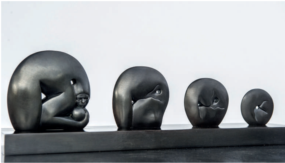
Jiménez Deredia Genesis Canto alla Vita, 2009 bronzo, patina canna di fucile, cm 48 x 13 x 12, tiratura: 12/100