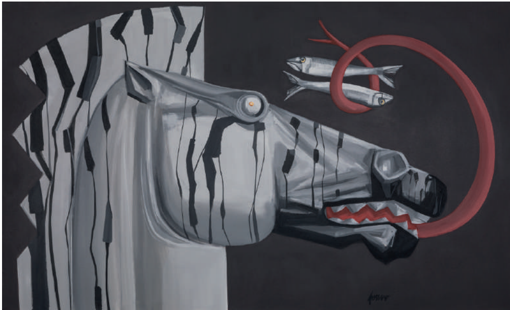
Tano Pisano Capriccio, 2019 vinilico su tela cm 90 x 150