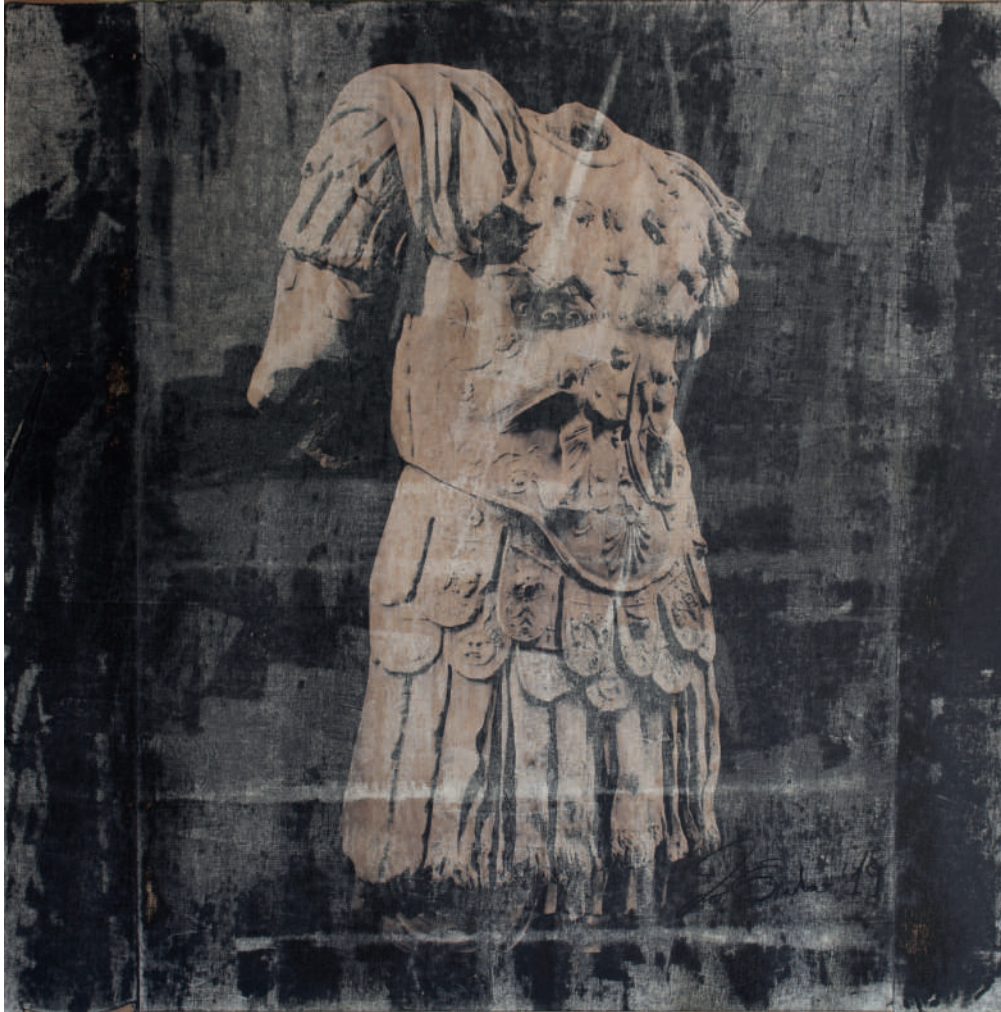
Jo Endoro Torso Cesar, 2019 tecnica mista su legno cm 122 x 122