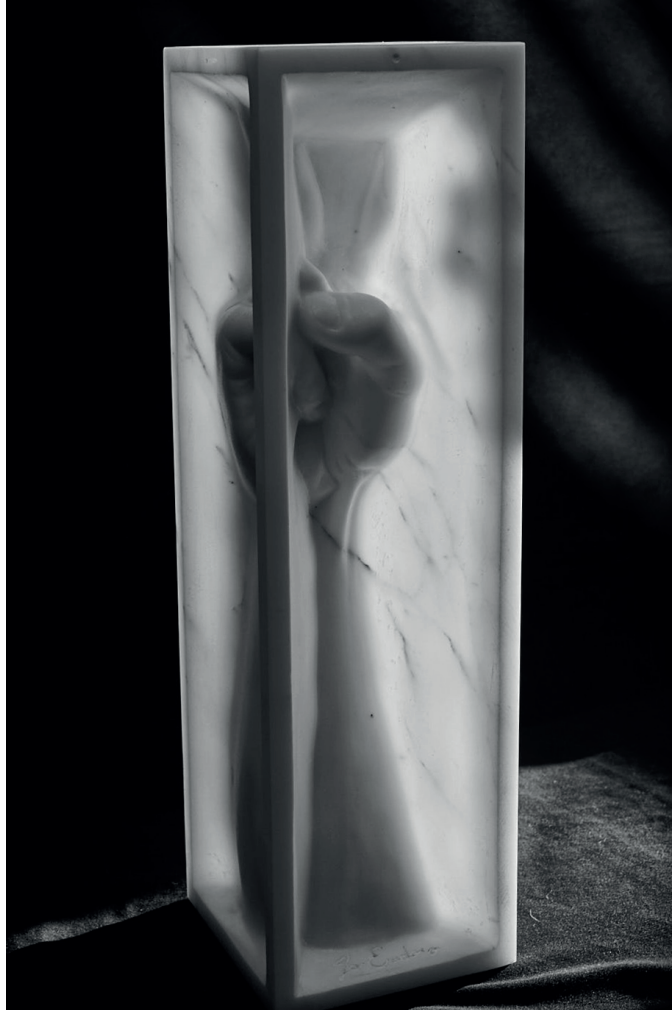
Jo Endoro La Vittoria, 2018 marmo cm 12,5 x 12,5 x 40