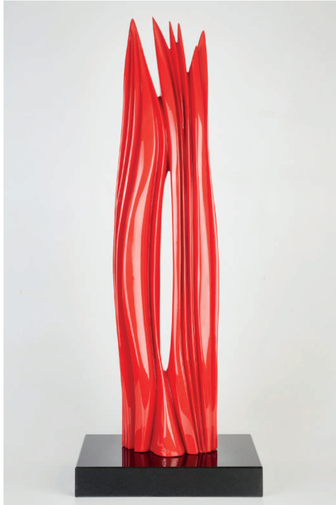
Pablo Atchugarry Solidarietà, 2020

bronzo, con vernice per autoveicoli ed. P.A. cm 87,5 x 20 x 13