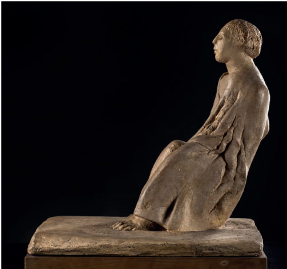
Giuliano Vangi Figura seduta, 1983 terracotta policroma cm 52 x 38 x 50,5, pezzo unico