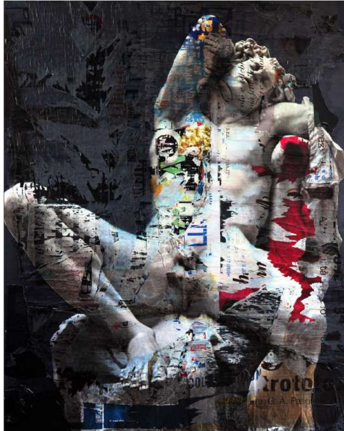
Andrea Chisesi Fauno dormiente, 2019 tecnica mista, cm 120 x 150