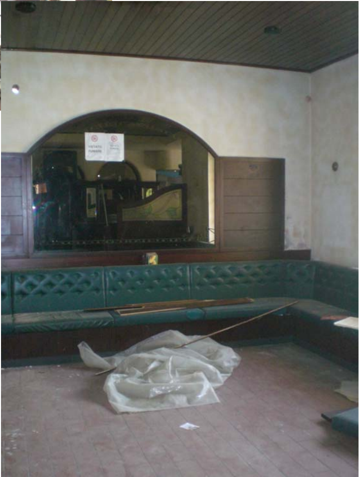
FOTO 6 sala