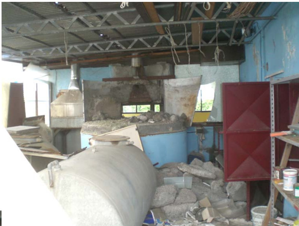
FOTO 11 cucina