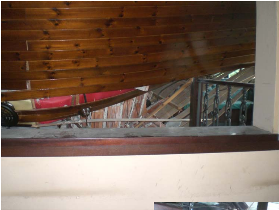
FOTO 7 soletta crollata