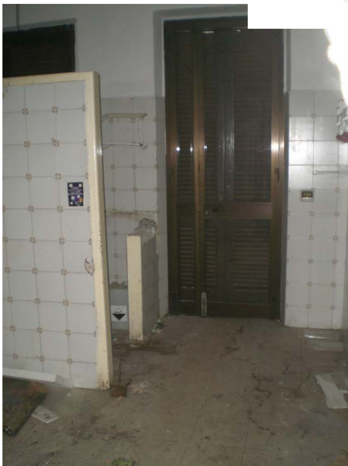
FOTO 12 scala