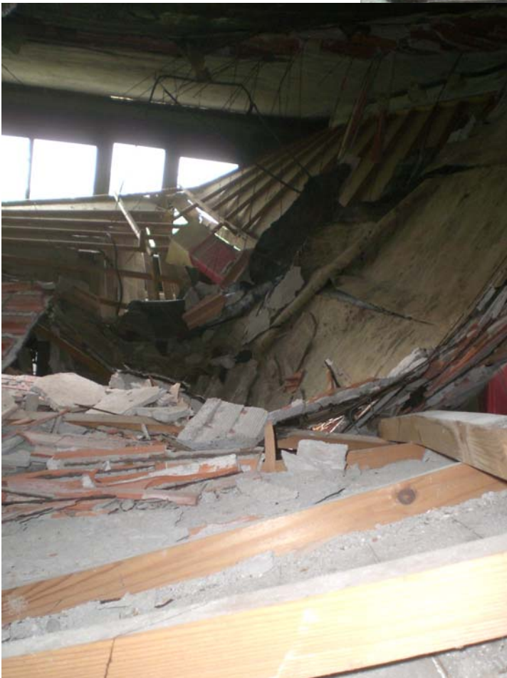
FOTO 9 soletta crollata