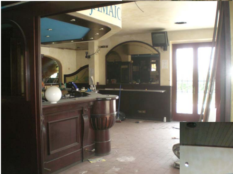
FOTO 5 sala