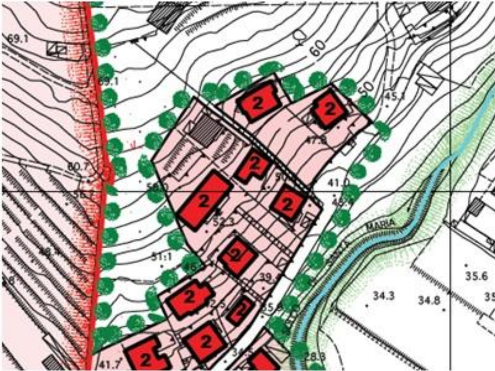
Regolamento urbanistico estratto tav 5P- Stato attuale