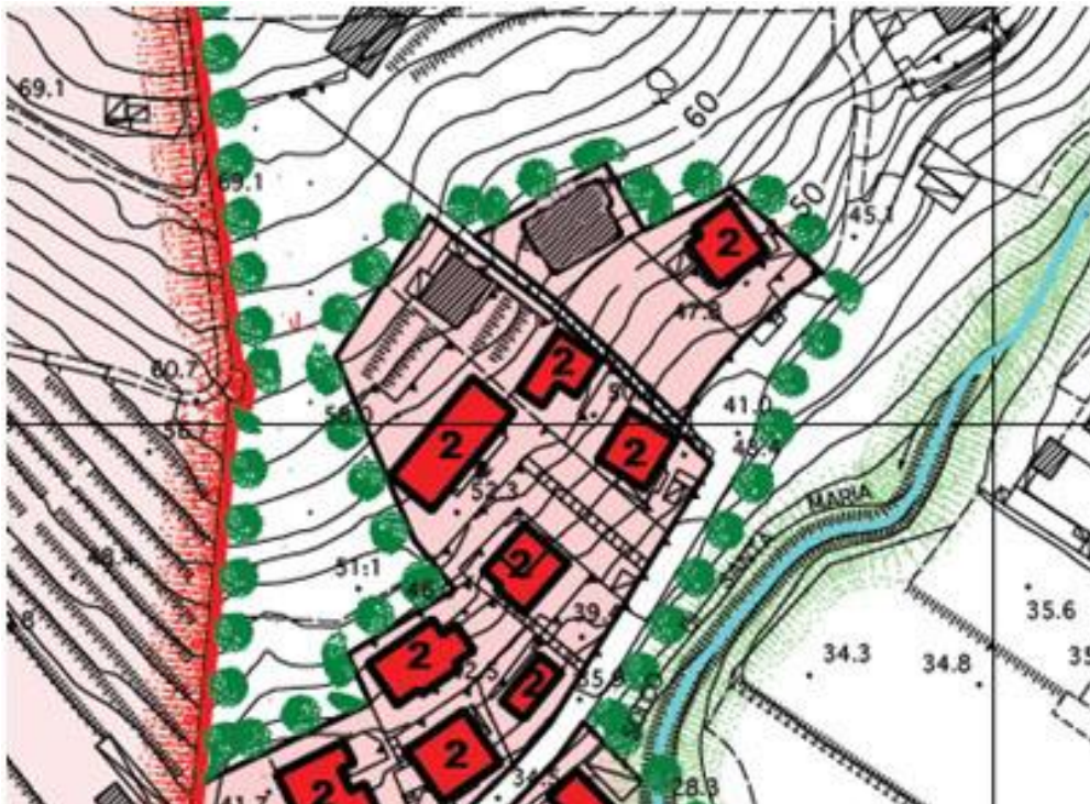
Regolamento urbanistico estratto tav 5P- Stato modificato