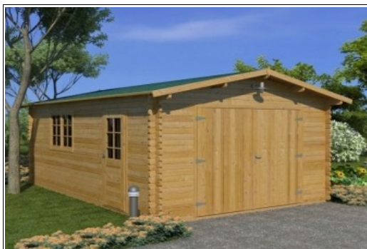
Magazzino ( n. 1 elaborato grafico)