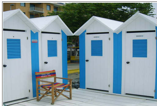
WC disabili e cabina spogliatoio n. 2-3-4 (elaborato grafico)